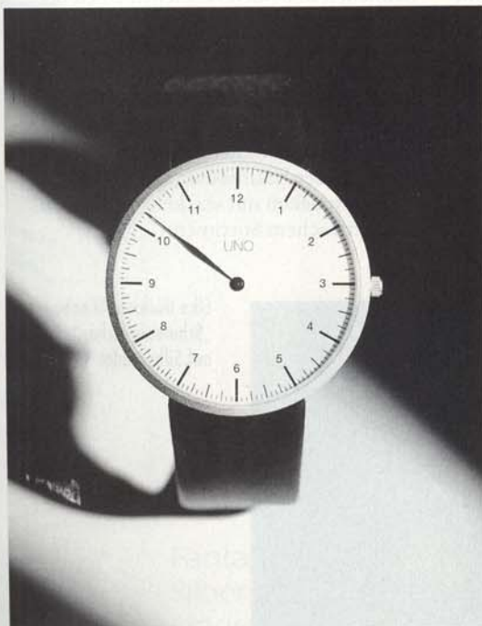
Watchpeople, Schöll & Brassler GmbH, München „Uno“, die Einzeigeruhr, Messinggehäuse, verchromt oder schwarz, Ronda Quarzwerk. Design: Klaus Botta