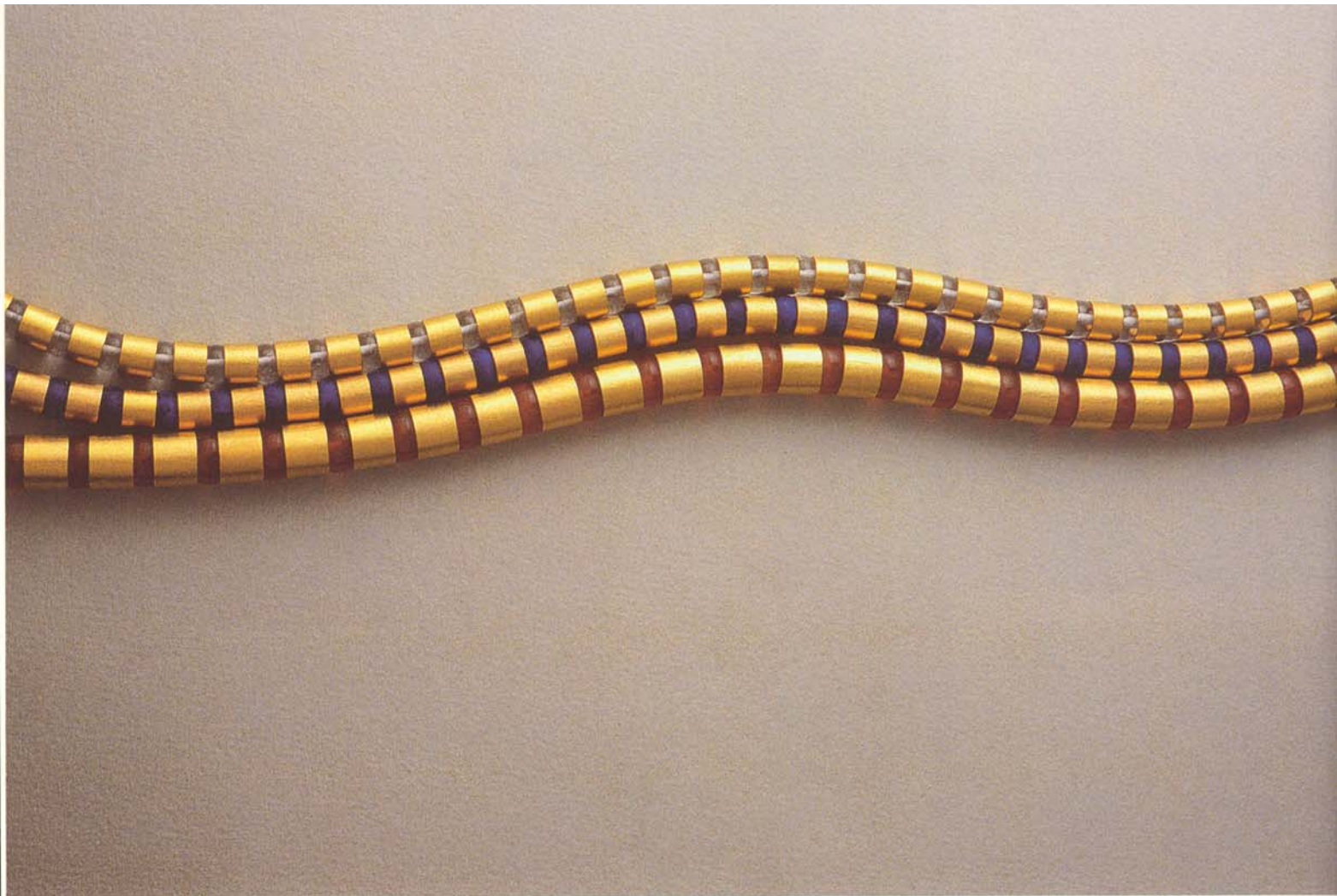
Kleopatra-Kollier Gold 750, Karneol, Lapis Lazuli, Bergkristall "Cleopatra" collier in 750/000 grade gold with carnelian, lapis lazuli and rock crystal